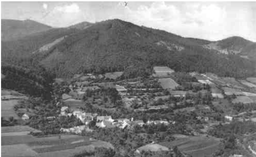
Bild 3 : Vießling, betrachtet vom Bruckberg. Auffallend ist die intensive landwirtschaftliche Nutzung in Form von Wiesen und Äckern.