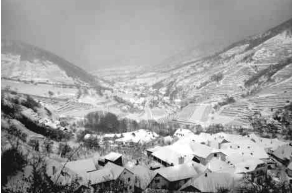
Bild 10: Vießling im Winter 1995/96 mit Blick in Richtung Elsarn und Mühldorf.