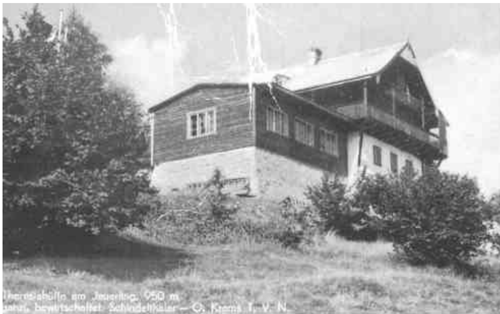
Bild 5: Das ehemalige Ausflugsgasthaus Theresienhütte am Jauerling gehörte bis 1975 zur Gemeinde Gut am Steg.